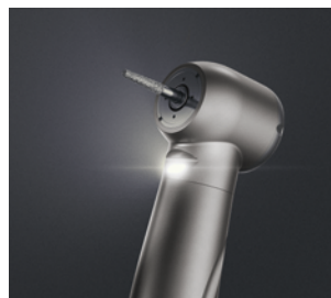
PRIME LINE PAGE 04

Chez MK-dent, la qualité n'est pas une simple caractéristique - c'est notre philosophie. Avec passion, expertise et précision, nous concevons des instruments qui inspirent confiance et permettent aux professionnels dentaires d'atteindre l'excellence chaque jour.