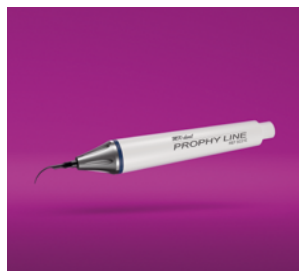
PROPHY LINE PAGE 08